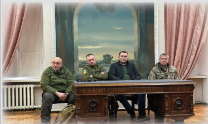
Круглий стіл «Ніжин: два роки війни очима учасників (2022–2024 рр.)»