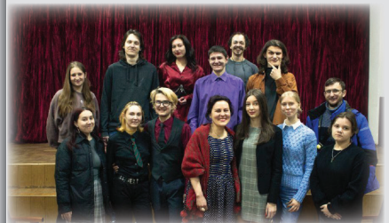
Літературний вечір «Si poesia!»