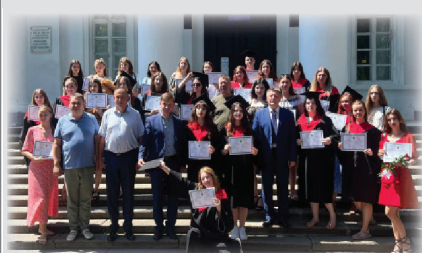
Вручення дипломів випускникам-бакалаврам