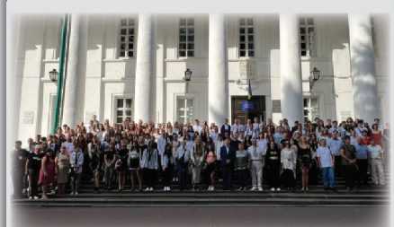
День знань у Гоголівському виші