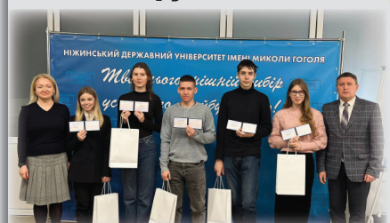
Вручення стипендій Президентського Фонду Леоніда Кучми