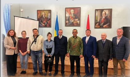
Місяць індонезійської культури в Ніжинському університеті