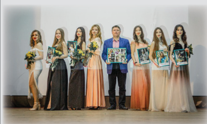
Конкурс «Міс НДУ-2024. Нескорена краса»