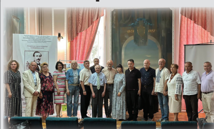
205 років від дня народження Пантелеймона Куліша