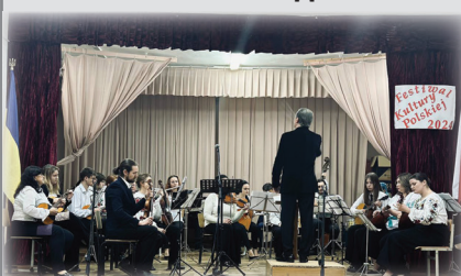
Фестиваль польської культури