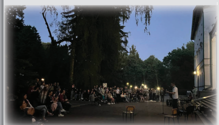
Благодійний концерт «Червень Music Awards»