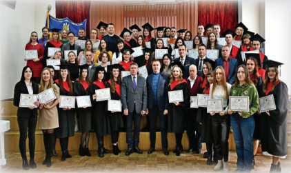
Вручення дипломів магістрам