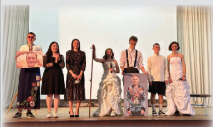
Міжфакультетський гумористично-творчий батл «Кубок ректора»